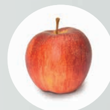
LED HQ : Le rouge reste rouge