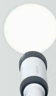
LED HQ : Éclairage de qualité HEINE