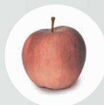
LED normale: Couleurs dénaturées